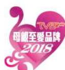
母親至愛數學教室