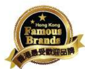
香港最受歡迎品牌