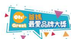
爸媽最愛品牌大獎