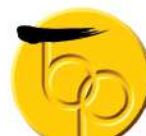
香港卓越服務名牌